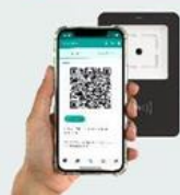
CÓDIGO QR DE LA APP