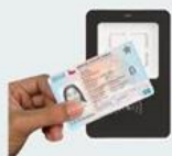
CARNET DE IDENTIDAD